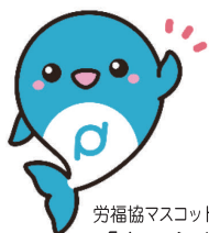
労福協マスコットキャラクター 「きょうちゃん」

主催：一般社団法人 山口県労働者福祉協議会 〒753-0078 山口県山口市緑町3番29号 TEL 083-925-7332 FAX 083-921-1650